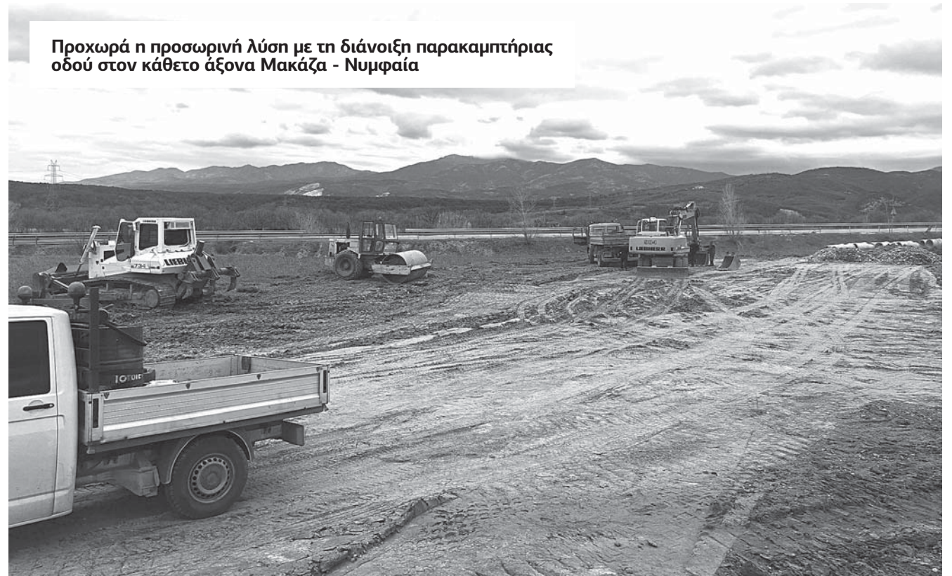
Προχωρά η προσωρινή λύση με τη διάνοιξη παρακαμπτήριας οδού στον κάθετο άξονα Μακάζα - Νυμφαία