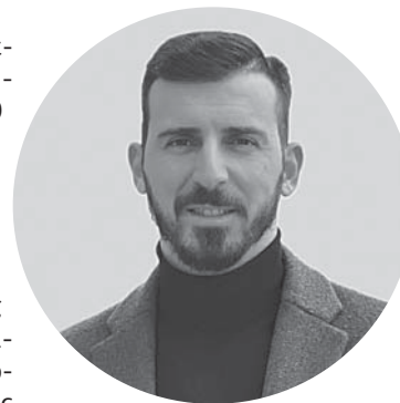
ΤΟΥ ΓΙΑΝΝΗ ΑΡΧΟΝΤΑΚΗ*

ΔΗΜΟΤΙΚΗ ΕΠΙΧΕΙΡΗΣΗ ΥΔΡΕΥΣΗΣ ΑΠΟΧΕΤΕΥΣΗΣ ΔΗΜΟΥ ΑΛΕΞΑΝΔΡΟΥΠΟΛΗΣ