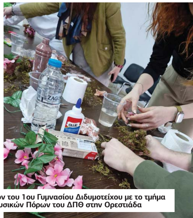
Επίσκεψη γνωριμίας των μαθητών και μαθητριών του 1ου Γυμνασίου Διδυμοτείχου με το τμήμα Δασολογίας & Διαχείρισης Περιβάλλοντος & Φυσικών Πόρων του ΔΠΘ στην Ορεστιάδα