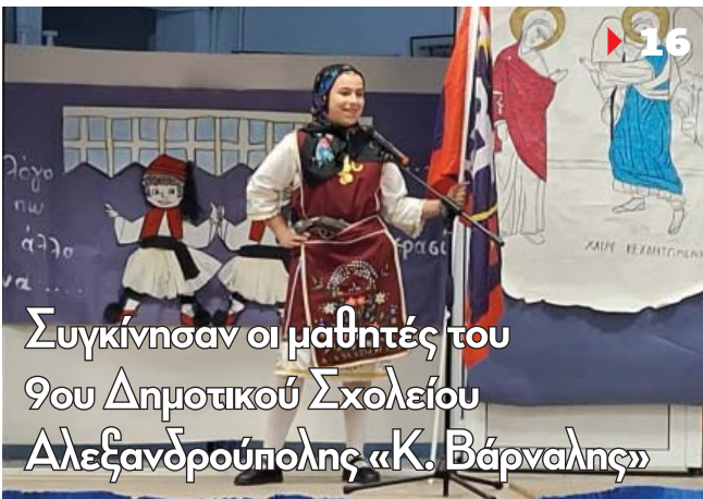
Συγκίνησαν οι μαθητές του 9ου Δημοτικού Σχολείου Αλεξανδρούπολης «Κ. Βάρναλης»