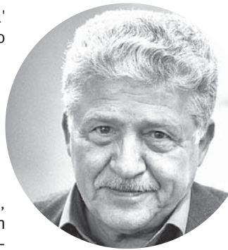
ΤΟΥ ΘΟΔΩΡΟΥ ΟΡΔΟΥΜΠΟΖΑΝΗ

Είναι αν το ίδιο το σύστημα μπορεί να σταθεί στο ύψος της στιγμής ή αν θα συνεχίσει να σκοντάφτει... ακόμη και στα πιο αυτονόητα.