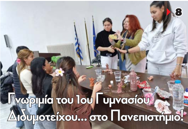
Γνωριμία του 1ου Γυμνασίου Διδυμοτείχου... στο Πανεπιστήμιο!