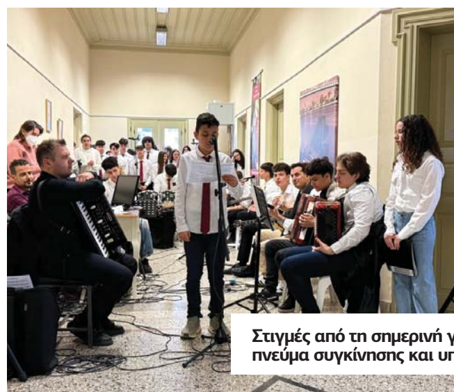
Στιγμές από τη σημερινή γιορτή αποτυπώνουν το πνεύμα συγκίνησης και υπερηφάνειας που κυριάρχησε.