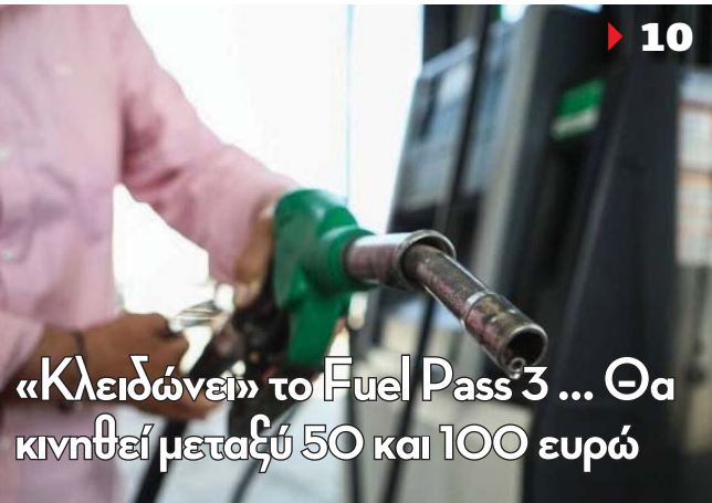
«Κλειδώνει» το Fuel Pass 3 ... Θα κινηθεί μεταξύ 50 και 100 ευρώ