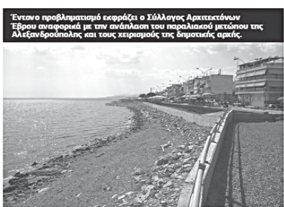
Ένα προβληματικό σκεπτικό ο Σύλλογος Αρχιτεκτόνων Έβρου αναφορικά με την ανάπλαση του παραλιακού μετώπου της Αλεξανδρούπολης και τους χειρισμούς της δημοτικής αρχής.

Όλο αυτό το κλίμα, δεν είναι σε καμία περίπτωση ανταποκρινόμενο. Ο ρόλος του αρχιτέκτονα δεν περιορίζεται στο σχεδιασμό επιτελικών κινήσεων ή τη γραφειοκρατική διαμετρική αξιολόγηση. Ο αρχιτέκτονας οφείλει και είναι ικανός, σύμφωνα τόσο με τα επαγγελματικά του δικαιώματα-υποχρεώσεις, όσο και την επιστημονική του κατάρτιση να συμβάλει στον σχεδιασμό και την διαμόρφωση των κατασκευασμένων στο σχεδιασμό του αστικού δημόσιου χώρου. Την τάση αυτή, σε μέρους της δημοτικής αρχής, φέρνει στην δημοσιότητα διάφορες δηλώσεις που αφορούν μελέτες για το παραλιακό μέτωπο της πόλης. Είναι γεγονός ότι αυτές οι μελέτες μπορεί να ανταποκρίνονται σε ένα γενικό πλαίσιο «ανάπτυξης» της πόλης - αλλά - παρόλα αυτά δεν παύουν να είναι αποσπασματικές ή ακόμη και αντικρουόμενες. Ενδεικτικά αναφέρουμε ότι σε διάστημα μερικών μηνών έχουν εκπονηθεί μερικά προγράμματα τμήματος της παραλιακής αποσπασματικά σκεπτικά ή δυναμικά των ήδη υποβαθμισμένων περιοχών που βρίσκονται σε επαφή με την θάλασσα ενώ επικυρώνεται το εμπορικό και ψυχαγωγικό κέντρο της πόλης.