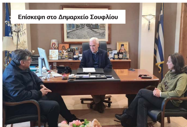
Επίσκεψη στο Δημαρχείο Σουφλίου