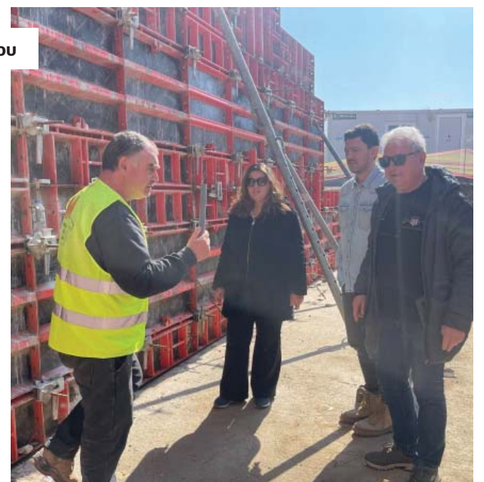
Σε πλήρη εξέλιξη οι εργασίες για την κατασκευή του μουσείου