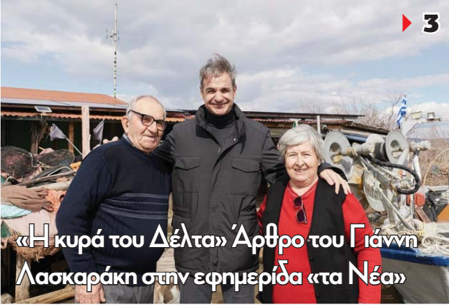
«Η κυρά του Δέλτα» Άρθρο του Γιάννη Λασκαράκη στην εφημερίδα «τα Νέα»