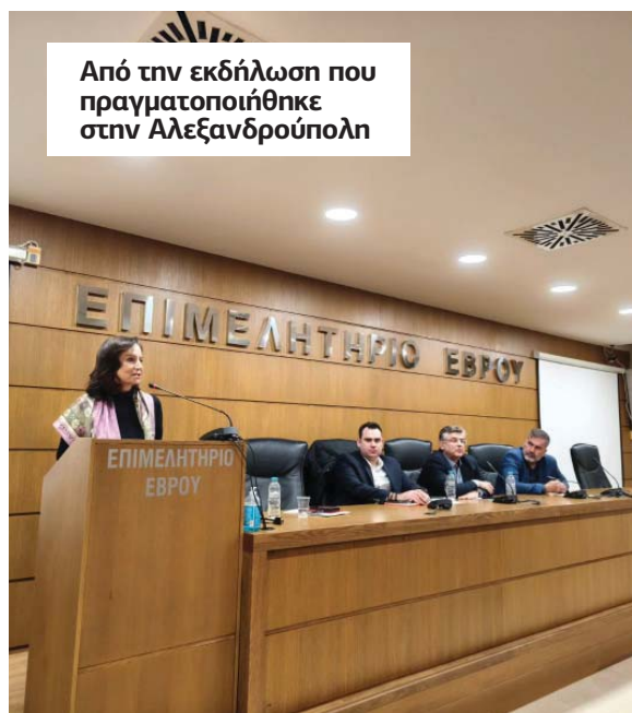
Από την εκδήλωση που πραγματοποιήθηκε στην Αλεξανδρούπολη