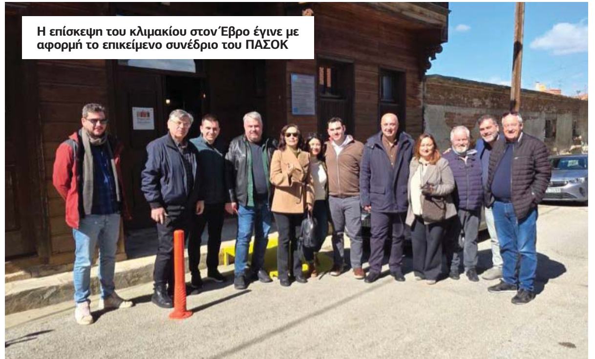
Η επίσκεψη του κλιμακίου στον Έβρο έγινε με αφορμή το επικείμενο συνέδριο του ΠΑΣΟΚ

Στη συνέχεια της ίδιας ημέρας, παρατέθηκε πολιτική εκδήλωση-ολομέλεια, στο πλαίσιο του Προσυνεδριακού Διαλόγου του Κινήματος,