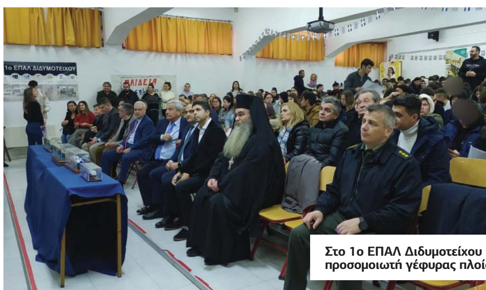
Στο 1ο ΕΠΑΛ Διδυμοτειχου παραδόθηκε δωρεά σύγχρονου προσομοιωτή γέφυρας πλοίου για τον ναυτιλιακό τομέα

Για το Δήμο Ορεσιτιάδας, η συνδρομή του Ιδρύματος Ευγενίδου είναι ανεκτίμητη, καθώς θέτει τις βάσεις για την ανάπτυξη των δεξιοτήτων των νέων του τόπου μας, σημειώνεται