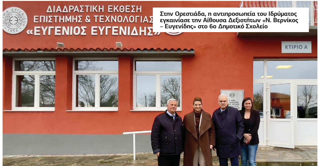
Στην Ορεσιτιάδα, η αντιπροσωπεία του Ιδρύματος εγκαινίασε την Αίθουσα Δεξιοτήτων «Ν. Βερνίκος - Ευγενίδης» στο 6ο Δημοτικό Σχολείο

Η επιλογή του Έβρου για την έναρξη των εορταστικών εκδηλώσεων αποτελεί τιμή για τον τόπο μας και αναγνώριση της ιστορικής και συμβολικής του σημασίας, αναφέρει ο Δήμος Διδυμοτειχου που εκφράζει τις θερμές του ευχαριστίες προς τον Πρόεδρο και το Ίδρυμα Ευγενίδου για τη μεγάλη δωρεά, τη στήριξη στη νέα γενιά και την εμπιστοσύνη τους στην εκπαιδευτική μας κοινότητα.