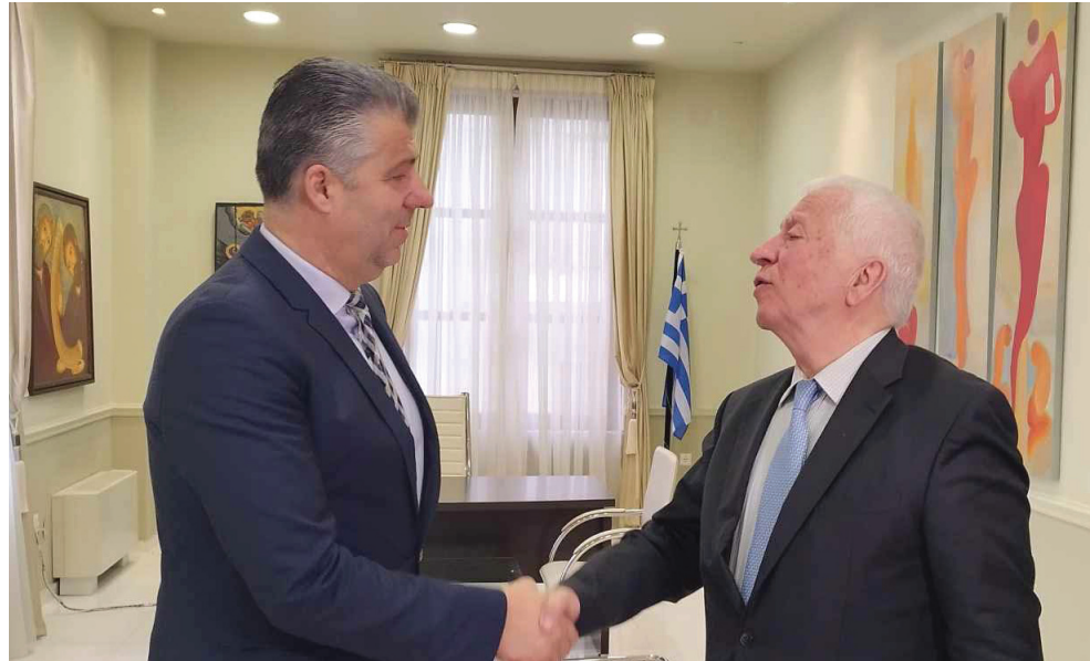
Μετά την Αλεξανδρούπολη, οι δύο Περιφερειάρχες θα συναντηθούν τον Μάιο και στη Μυτιλήνη, όπου θα υπογράψουν Μνημόνιο Συνεργασίας

σβο, προκειμένου οι δύο πλευρές να υπογράψουν Μνημόνιο Συνεργασίας. Η ακτοπλοϊκή σύνδεση που προτείνεται και που έχει ήδη συζητηθεί με συγκεκριμένη ακτοπλοϊκή εταιρεία, σε επίπεδο διεκπεύρωσης των δυνατοτήτων για την δρομολόγησή της, στόχος είναι να συνδέει Αλεξανδρούπολη και Σαμοθράκη με Λέσβο και όσα ακόμη νησιά είναι εφικτό. Η πίεση προς την κεντρική πολιτική Ναυτιλίας θα είναι η γραμμή να