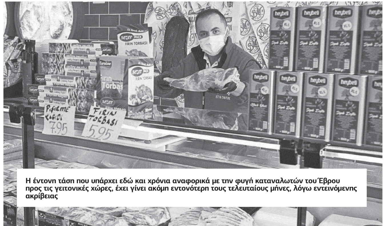
Η έντονη τάση που υπάρχει εδώ και χρόνια αναφορικά με την φυγή καταναλωτών του Έβρου προς τις γειτονικές χώρες, έχει γίνει ακόμη εντονότερη τους τελευταίους μήνες, λόγω εντεινόμενης ακρίβειας

Οι φτηνές τιμές της Βουλγαρίας αποτελούν επίσης πόλο