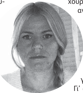
ΤΗΣ ΓΙΩΤΑΣ ΑΓΑΠΗΤΟΥ