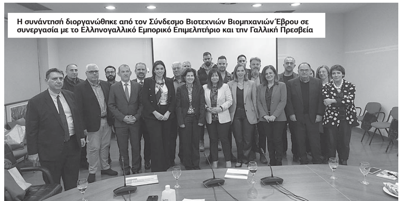
Η συνάντησή διοργανώθηκε από τον Σύνδεσμο Βιοτεχνιών Βιομηχανιών Έβρου σε συνεργασία με το Ελληνογαλλικό Εμπορικό Επιμελητήριο και την Γαλλική Πρεσβεία

σθετα ζητήθηκε η κορήγηση κίνητρων ικανών να προσελκύσουν νέα επενδυτικά σχέδια στην Περιφέρεια ΑΜΘ, ενώ τονίστηκε η ανάγκη πρόσβασης των επιχειρήσεων σε δάνεια με ανταγωνιστικό ή χαμηλό επιτόκιο και ρεαλιστικούς όρους για την περιφερειακή βιομηχανία (Ελλάδα 2.0, ΕΚΤ, ΕΒΡΔ). Τέλος, η αντιπροσωπεία εξέφρασε αίτημα να υπάρξει ειδική ζώνη κινήτρων, ειδικά για τις ΜΜΕ της ευρύτερης περιοχής, στην νέα προγραμματική περίοδο, καθώς και ικανή μοριοδότηση και έγκαιρη καταβολή των επιχορηγήσεων ώστε να υλοποιηθούν επενδύσεις στην Περιφέρεια ΑΜΘ.